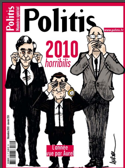
2010 horribilis, rétrospective de l'année 2010 vue par Aurel. Numéro spécial de la revue « Politis »

Face aux textes, comment l'information est-elle traitée dans le dessin de presse ? Commenter, dénoncer, informer, polémiquer, amuser : quelles sont les fonctions du dessin de presse ? Un dessinateur de presse doit-il être engagé et militant ? Quelle place pour le dessin de presse à l'heure de la révolution numérique ?