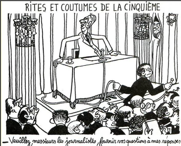
« Rites et coutumes de la cinquième » Dessin d'Effel, 1964